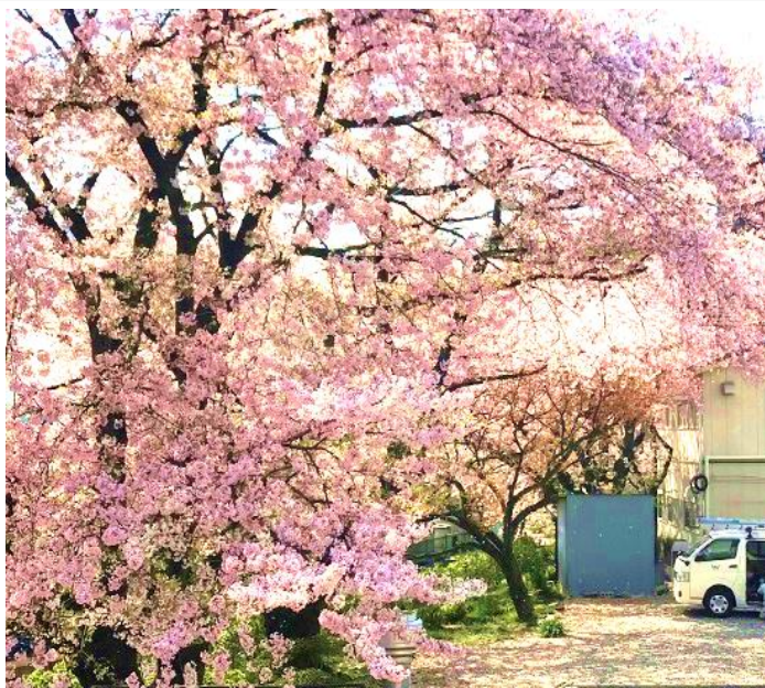
鶉工場 社屋からの望む桜